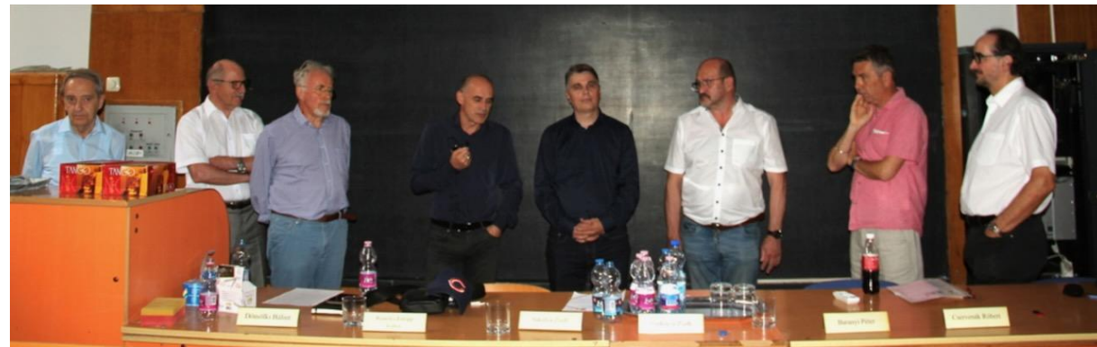
A térképektől a digitális Földig vezető rögös út – A magyar térinformatika a kezdetektől napjainkig c. iTf térinformatikai konferencia előadói. 2022.06.22. BME K épület

Az albumok tartalma szűrők (szó, címke, idő, esemény, szerző...) használatával kereshető