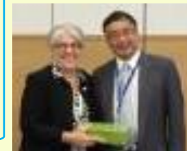
A GEO és ISDE igazgatói a DBAR bemutatásán