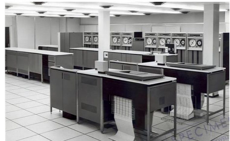
Adjon meg képfeliratot.