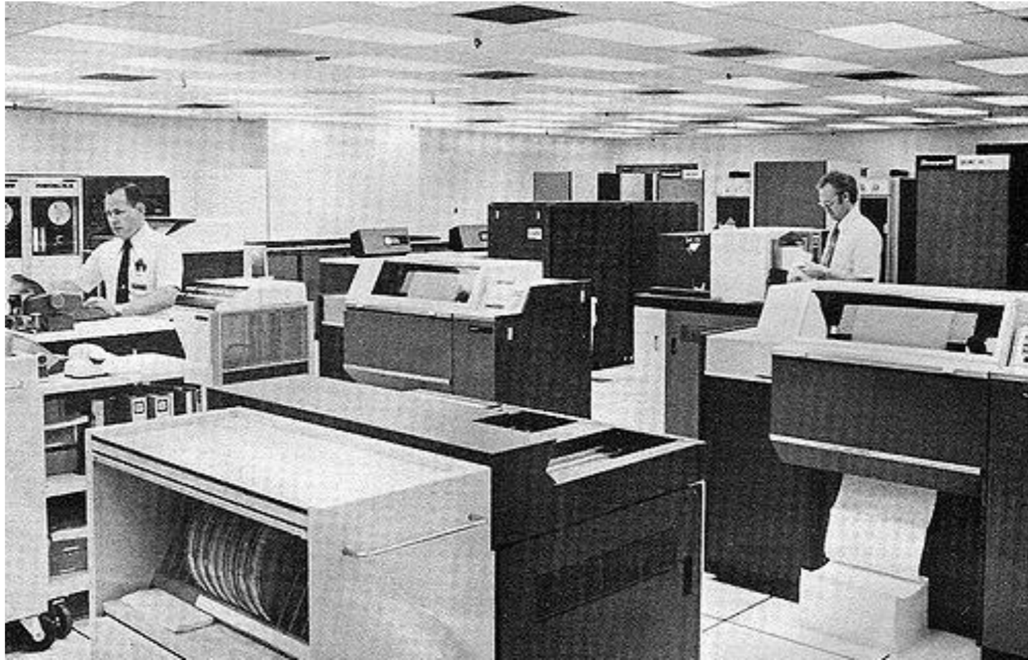
Adjon meg képfeliratot.