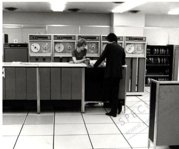
Adjon meg képfeliratot.